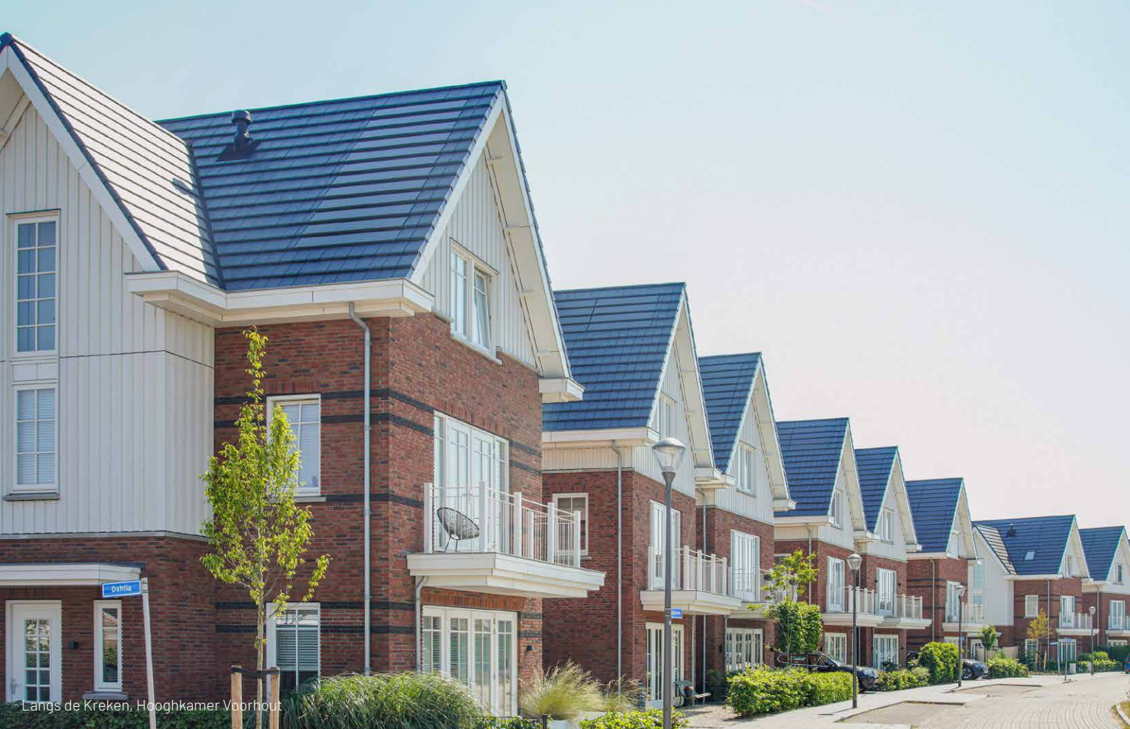
Langs de Kreken, Hoogkamer Voorhout

energieprestatie op nul wilden hebben. Een jaar later legde de overheid de verplichting van gasloos bouwen op. Waar andere bouwbedrijven daardoor plotseling hun bestaande plannen moesten ombuigen, was er bij ons geen paniek. Gasloos bouwen zat namelijk al in onze visie, plannen en werkwijze.”