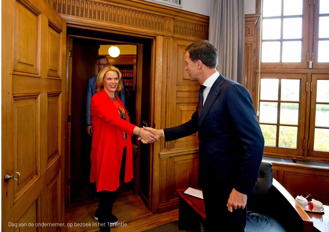
Dag van de ondernemer, op bezoek in het Torentje.